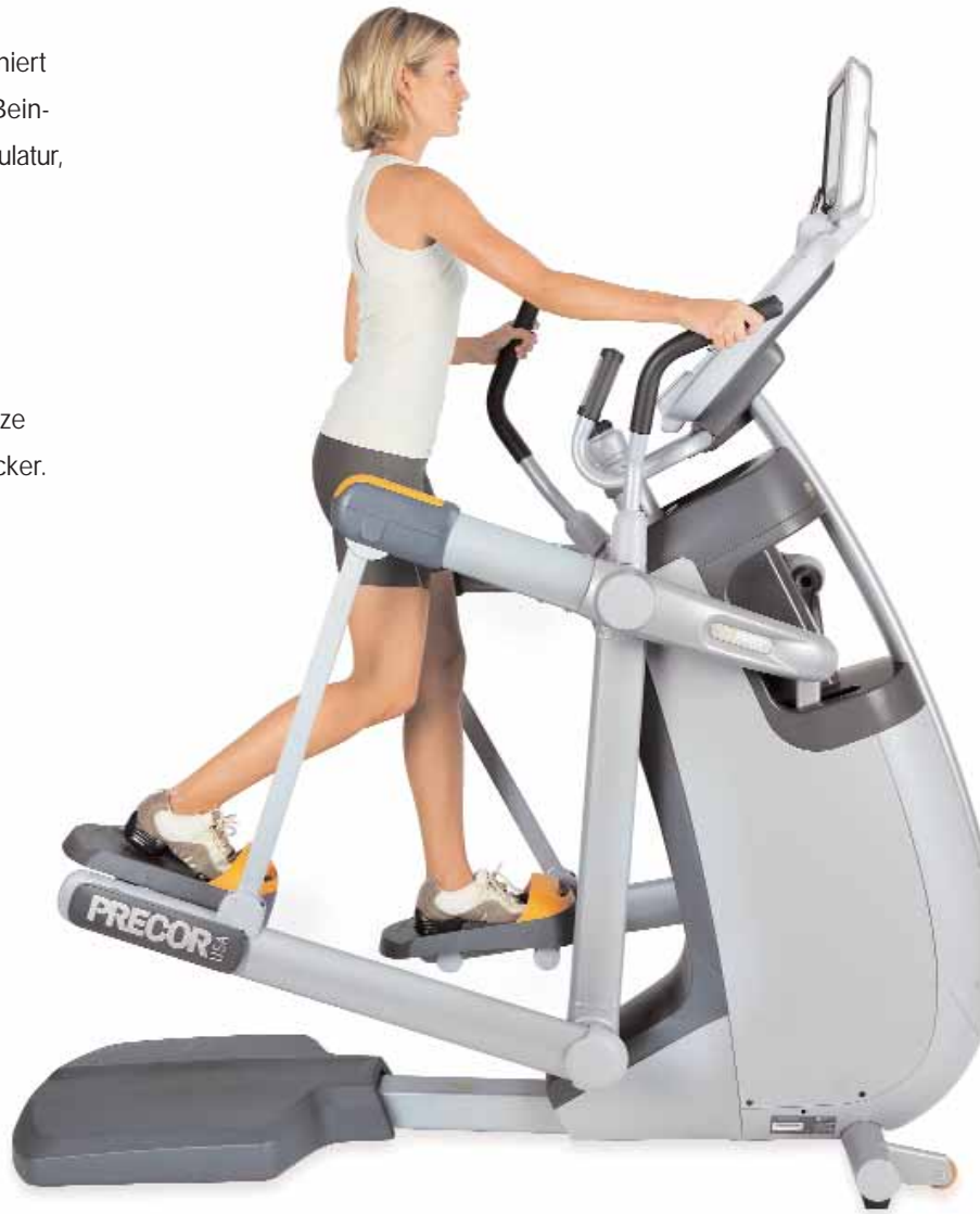
STRIDE GUIDE (Schrittanzeige) – 0 bis 69 cm

Ähnlich wie beim schnellen Laufen, aber bei deutlich geringerer Belastung, trainieren lange Schritte die gesamte Beinmuskulatur.